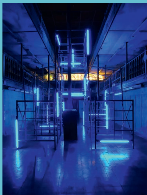
Christoph Dahlhausen, Stabilizing Light , 2013, Installation in La Mexicana, Chihuahua (Mexico)

Kontakt: Kunststiftung Erich Hauser Dr. Heiderose Langer, Geschäftsführerin Saline 36, 78628 Rottweil T +49 (0) 741 2800 18-0 info@erichhauser.de, www.erichhauser.de