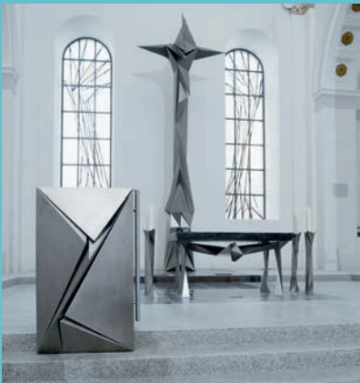
Innenraum, Kirche Sankt Maria in Schramberg

Veranstaltungshinweis: Jubiläum 175 Jahre Kirche Sankt Maria in Schramberg und 25 Jahre Kirchenkunst von Erich Hauser; Veranstaltungen am 19./20.10.2019. Weitere Infos: www.stmaria-hlgeist.de