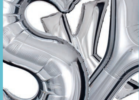
Andreas Schneider, Grafik-Entwürfe für Projekt Silver Sky, 2019