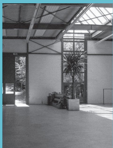
Blick in die Werkstatthalle