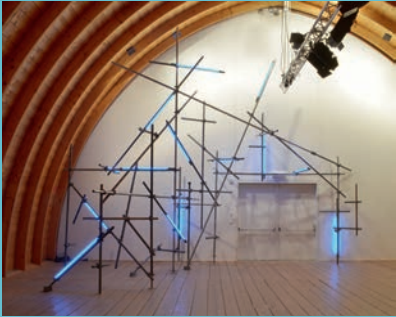
Christoph Dahlhausen, Stabilizing Light Freising, 2017 Installation im Schathof, Europäisches Künstlerhaus, Freising